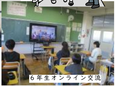
6年生オンライン交流

来年度の学校統合という大きな節目を控え、いよいよ学校間交流が本格的にスタートいたしました。第一歩は、5月7日に行われた2年生による「町探検」での交流です。当日は、薄根地区の探検を行いました。初めて足を踏み入れる隣町の景色に、子どもたちは興味津々でした。次に行ったのは、6年生のオンライン交流です。画面越しに、お互いのことを紹介合いました。まだまだ、緊張気味な子供たちです。この後、交流を重ねてお互いのことを知り、少しずつ「新しい仲間」としての実感を育てて参りたいと思います。