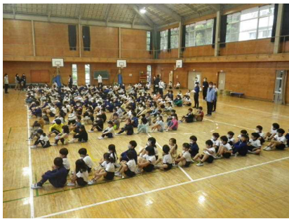
数年ぶりの全員集合。壮観！