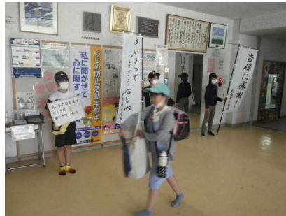
のぼりやポスターも効果的

企画委員と6年のあいさつ実行委員によるあいさつ運動の様子です。朝早くから玄関に立ち、爽やかにあいさつする姿は、見ていて非常に気持ちがいいものです。利南東小学校のあいさつは確実に向上し続けていると感じています。私も朝のあいさつを続けます。継続は力なりです。