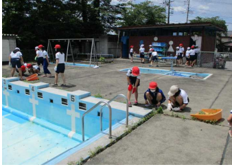
5年の作業:プールサイド