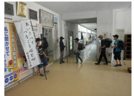
互いにあいさつを交わします