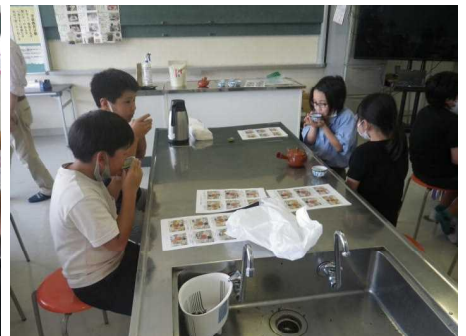
たいへんおいしくいただきました