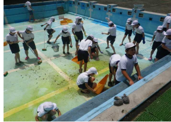
6年の作業:プール内

本校のリーダーである5・6年生が、時間をかけて丁寧に作業をしてくれました。5年生がプールサイドや外回りを、6年生がプール内を担当し、とても綺麗になりました。水泳学習の準備が整い、あとはプールに水を入れるだけです。来週6/20(火)のプール開きが待ち遠しいです!!