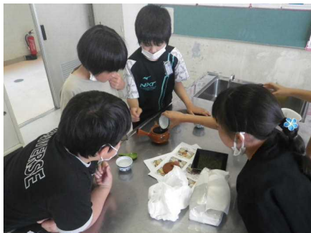
グループごとに淹れました