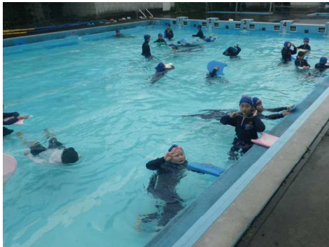
プール学習のまとめ: 着衣泳

令和5年度の第1学期が本日で終了しました。新型コロナの心配が残る中で始業式を迎え、5月8日の5類移行により学校における対応が大きく変わった、ある意味、激動とも言える学期でした。そんな状況にあっても、本校の230名は、いつでも明るく、伸び伸びと、前向きな姿勢で各種教育活動に一生懸命に取り組み、驚くほどの大きな成果を上げました。夏のプール学習をはじめとする各学年の学習活動、遠足や旅行、各種体験活動などの学校行事も予定どおり実施することができました。活気と落ち着きに満ちた学校全体の雰囲気は、私にとって一番の自慢です。本当にいい学校です。