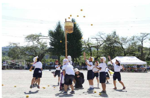
⑨1・2年「玉入れ」全校児童が踊り出す！