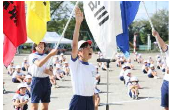
会場の空気が一変した素晴らしい選手宣誓！