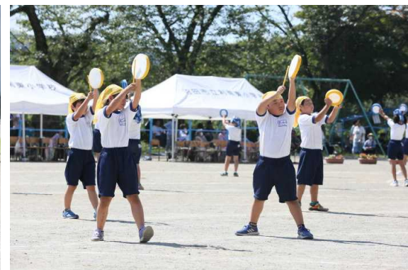
⑧3・4年「利南エイサー」今や伝統の演技！