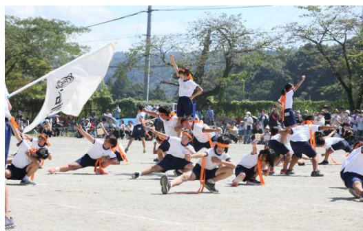
⑩5・6年「利南ソーラン2023」 新しい動きで魅せました。本当に凄い！