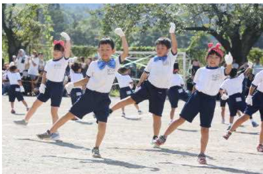
③1・2年「ジャンボリ・ミッキー」 みんなとっても楽しそう