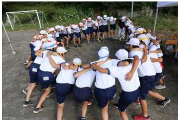
6年の円陣 かっこいい！