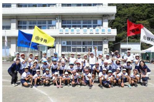
スーパーリーダー6年生 お疲れさま!!