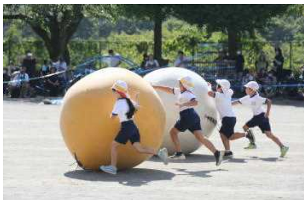
⑤3・4年「大玉ころがし」盛り上がりがすごい！