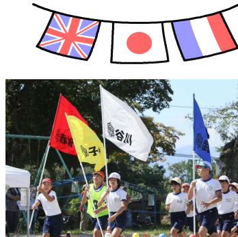
スーパーリーダー出陣