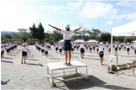
①ラジオ体操 とてもよく揃っていました