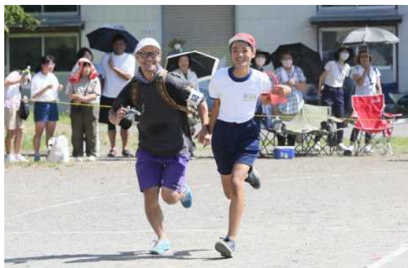
⑦5・6年「障害物リレー」PTA会長も参加！