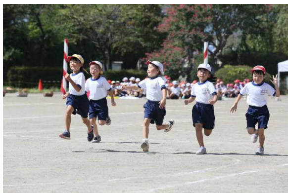
⑥1・2年徒競走 みんな一生懸命です