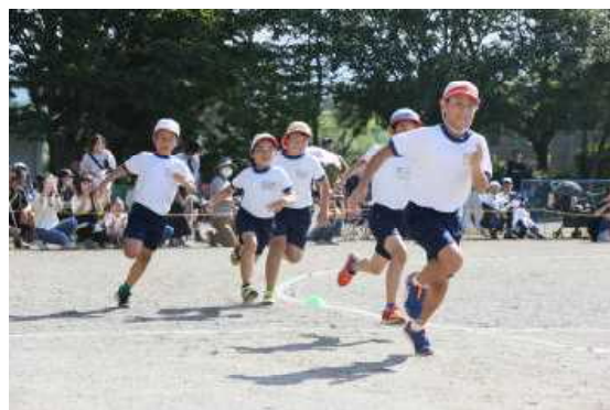
②3・4年徒競走 いきなり白熱のレース