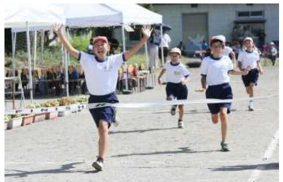
④5・6年徒競走 圧巻の走力 さすがです！