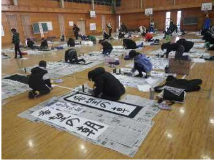
体育館で書き上げます