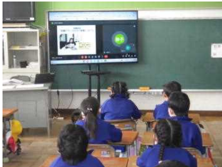
リモートで参観しました