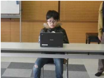
分担して発表します