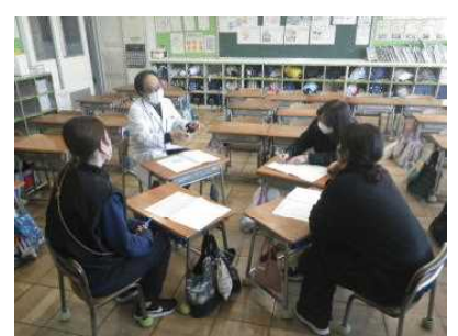
4班に分かれて協議しました

<つなぐ コラム> 3月1日(金)に「6年生を送る会」が開かれます。次のスーパーリーダーである5年生が中心になって準備を進めています。スローガンも決まって玄関に掲示されました。先輩への思いに溢れた非常に素晴らしい言葉です。6年生と5年生、そして1~4年生、みんな心でしっかりつながっています!!