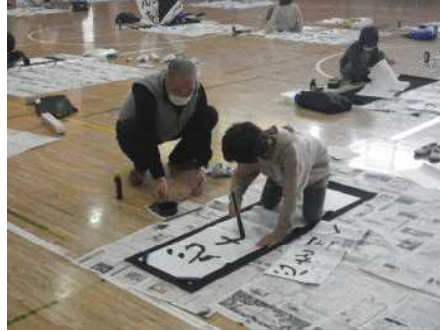
池田先生の丁寧なご指導