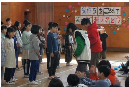
3年生のプレゼント