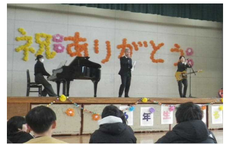
（サプライズで歌いました…）