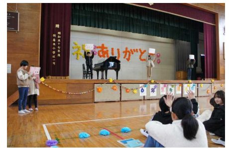
5年生の三択クイズ