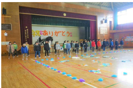
6年生の合唱「旅立ちの日に」