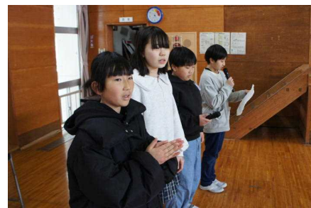
立派な進行の5年生