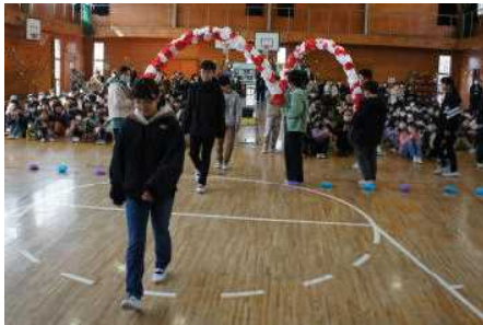
6年生がアーチで入場

3/1（金）に「6年生を送る会」を行いました。各学年が素晴らしい発表をしてくれました。どの学年の発表も6年生に対する感謝の思いに溢れていて、改めてスーパーリーダーである今年の6年生の凄さ、利南東小学校に残した数多くの功績を実感しました。6年生の歌も素晴らしかったです。6年生が作り上げてくれた利南東小の伝統は、この会を立派に進めてくれた5年生をはじめとする次の世代に確実に引き継がれます。次の新しいステージでも、自分らしさを思い切り発揮して、堂々と突き進んでほしいと思います。本当にありがとう！