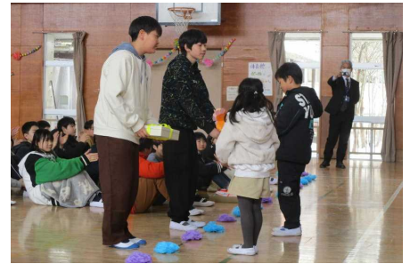
2年生のプレゼント