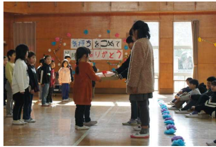
1年生のプレゼント