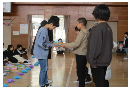
4年生 歌とプレゼント