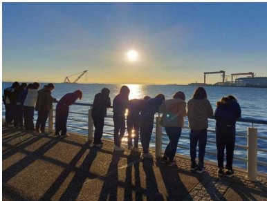
朝の散歩(極上の快晴)