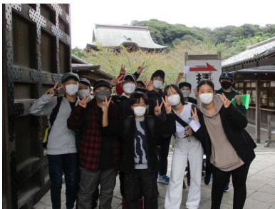
建長寺(班行動スタート)