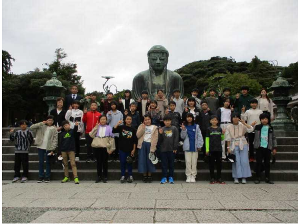
鎌倉大仏(天気もなんとかもちました)