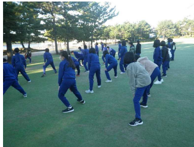
朝の体操(目が覚めました)