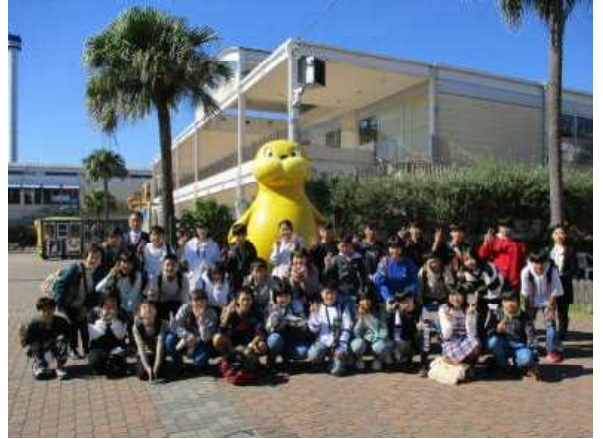
八景島シーパラダイス(シー太くと一緒に)