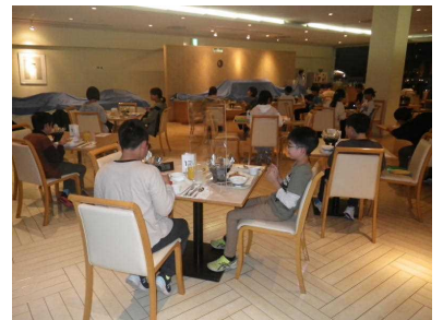
ホテルの夕食(おいしかった~)