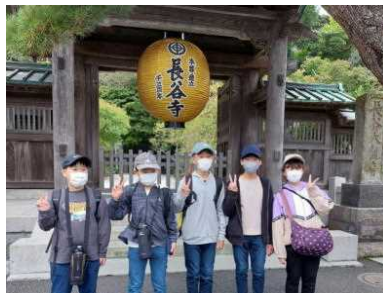
長谷寺(このあとお土産タイム)