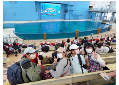
シーパラの一コマ(みんな満喫!)