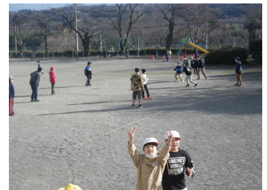
冬休みに仲良く遊ぶ子どもたち😊

年明けは、いよいよ「まとめの3学期」です。終わりよければすべてよし。職員一同、もう一度気合いを入れ直して、子どもたちのために、全力で取り組みます。変わらぬご支援ご協力をよろしく申し上げます。それでは、よいお年をお迎えください。