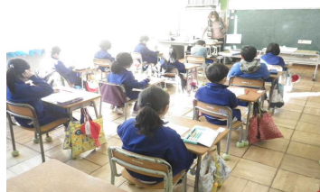
朝学習1年 「アシストシート」国語