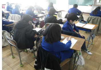
朝学習4年 「アシストシート」算数

1月はじめに全学年で実施した学力テスト「CRT」の結果が返ってきました。学力向上コーディネーターを中心に、結果を分析して対応を協議し、「学力強化月間」(2/21火～学年末)という取組を実施することになりました。具体的には、各学年で明らかになった課題を中心に、CRTの実施会社が提供する学習プリント「アシストシート」を積極的に活用します。朝学習の時間等を重点的に使って、学力の基盤となる基礎的・基本的な内容を徹底して身に付けさせ、次年度に向けて、