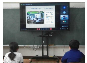
リモート保健集会 2/14