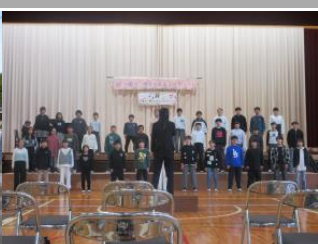
「利根小中合同音楽発表会」